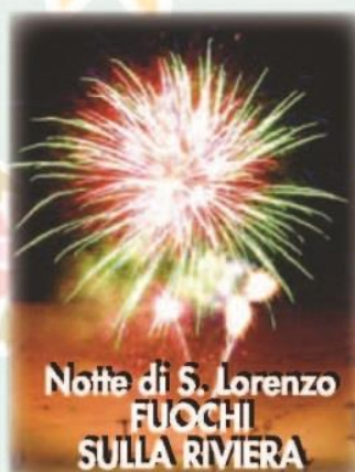
Notte di S. Lorenzo FUOCHI SULLA RIVIERA