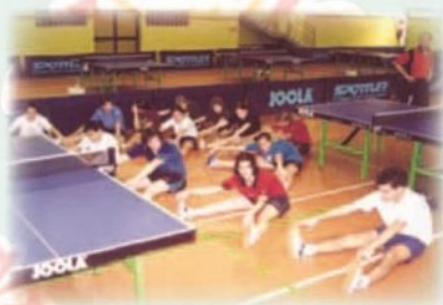
Technical physical preparation fit for tabletennis.