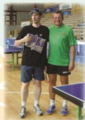
Grande tombolata finale